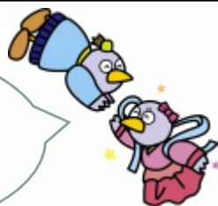
埼玉県マスコット コバトン